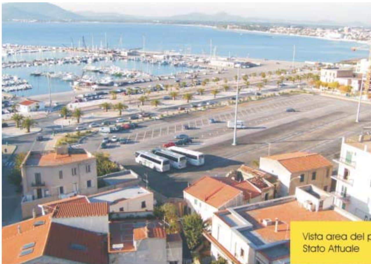
Vista area del piazzale Stato Attuale