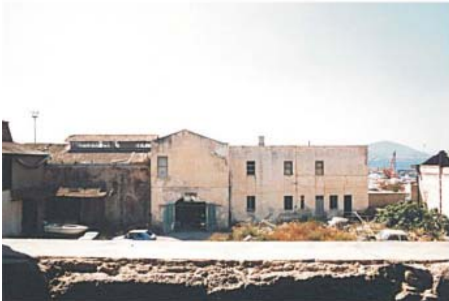
Vista dall'interno del cortile Complesso "ex Saica"