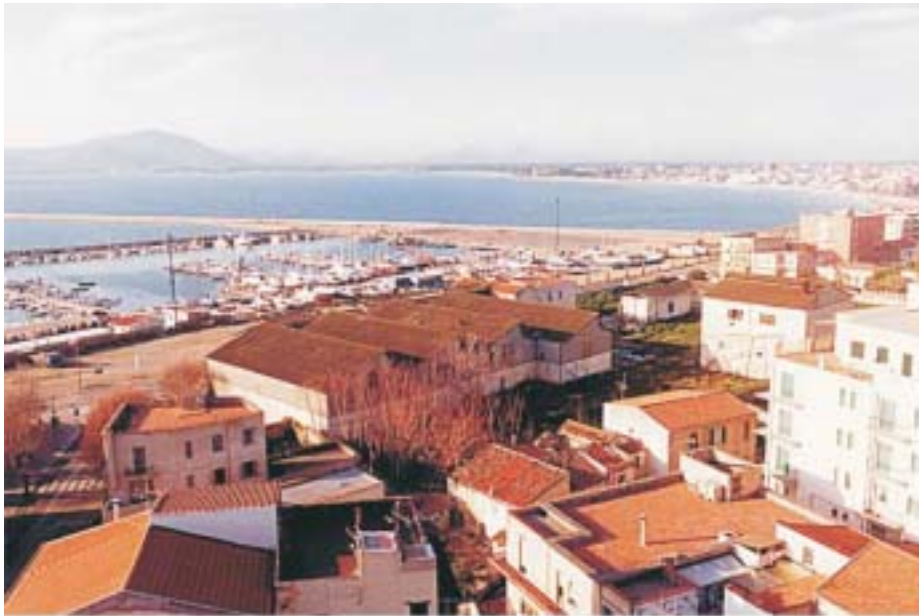
Vista aerea dal retro del Complesso "ex Saica"