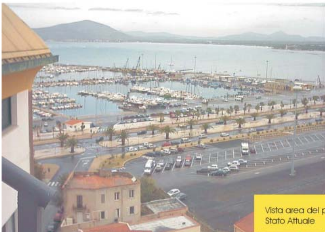
Vista area del piazzale Stato Attuale