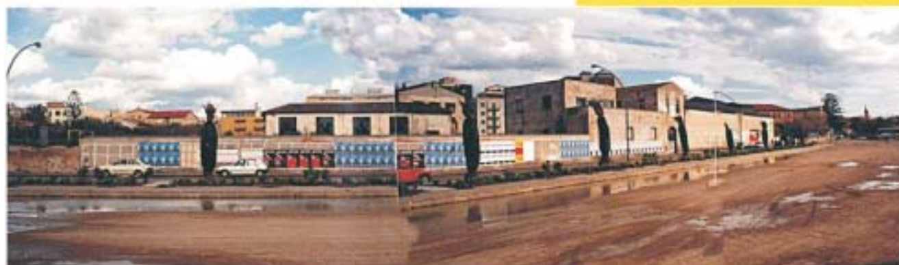
Vista del Complesso "Ex Saica" dalla Via Garibaldi