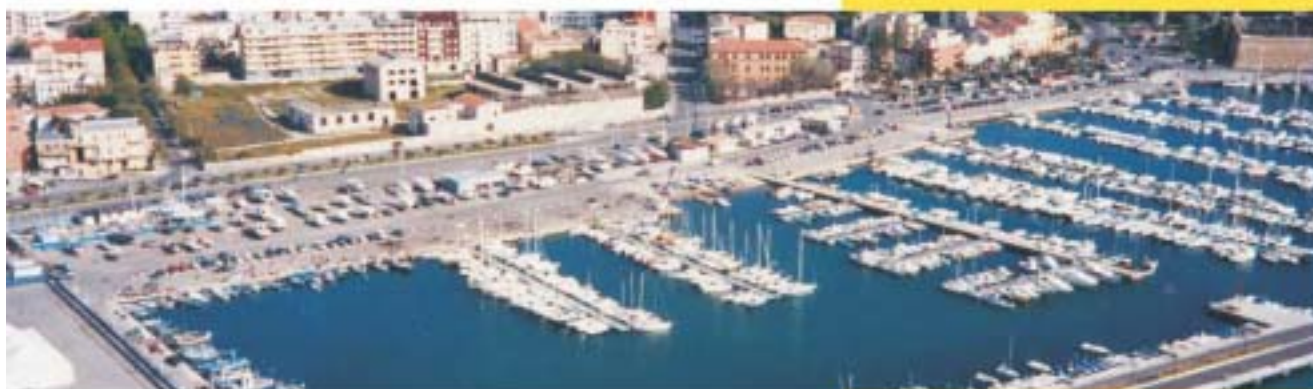
Vista aerea dalla Via Garibaldi