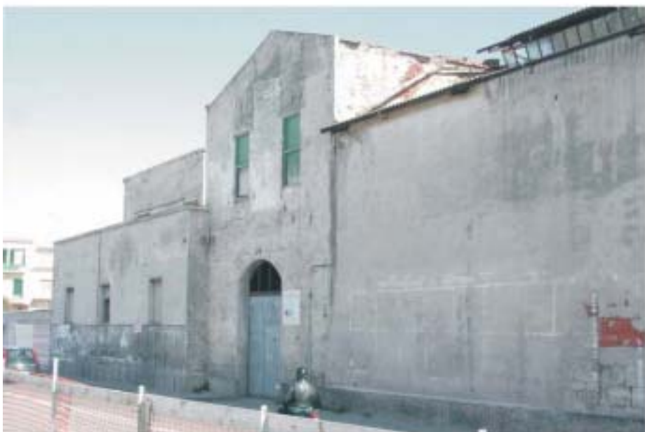
Vista dalla Via Garibaldi Complesso "ex Saica"