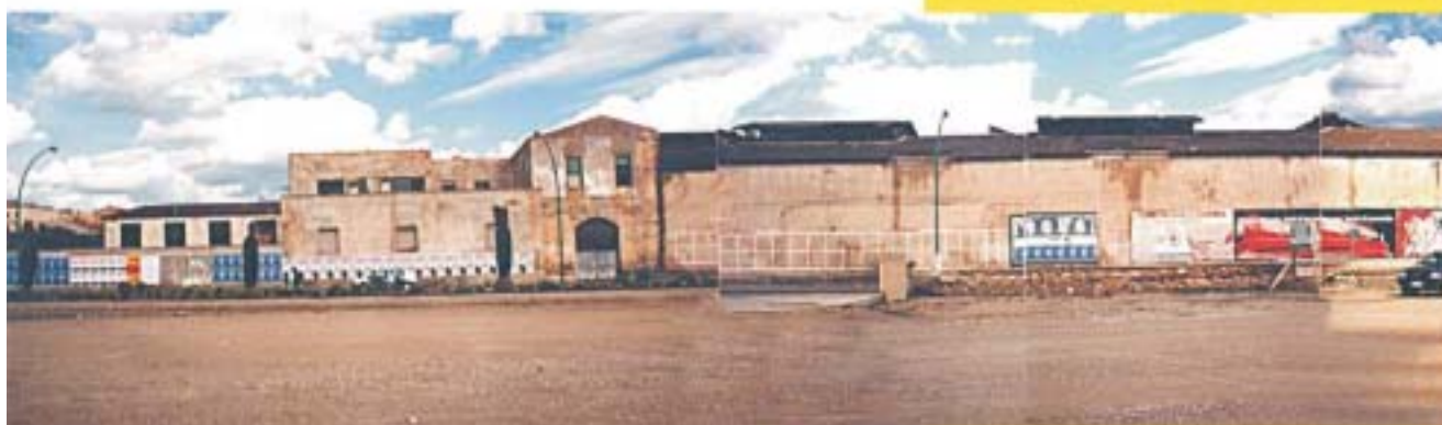
Vista del Complesso "Ex Saica" dalla Via Garibaldi